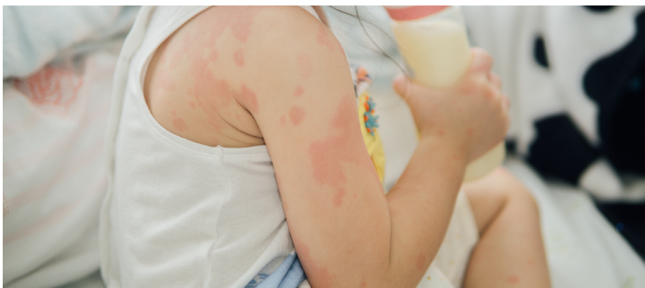
Fot. Kilkuletnia dziewczynka siedzi na łóżku, pije mleko z butelki, ma czerwone plamy na rękach, źródło: https://allergia.pl/projekty/niezbednik/

Innowacja jest oparta na współpracy z ekspertami z dziedziny zdrowia, psychologii i prawa. Materiały edukacyjne zostały opracowane w przystępny i jasny sposób, z uwzględnieniem potrzeb odbiorców, co potwierdzają ich opinie.