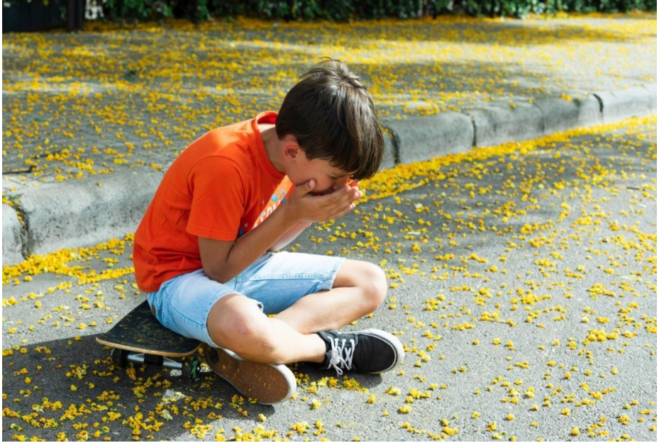
Fot. Kichający chłopczyk siedzący na deskorolce wśród pyłków z drzew. Zdjęcie pogładowe.